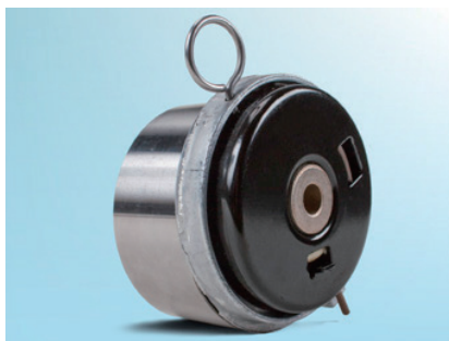
画像 3：以前の型式の背面図