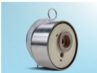
画像 1：以前の型式の正面図