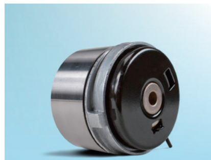
画像 4：新しい型式の背面図

継続的な製品開発により、テンションプーリー 531 0779 10 の仕様に変更されました。